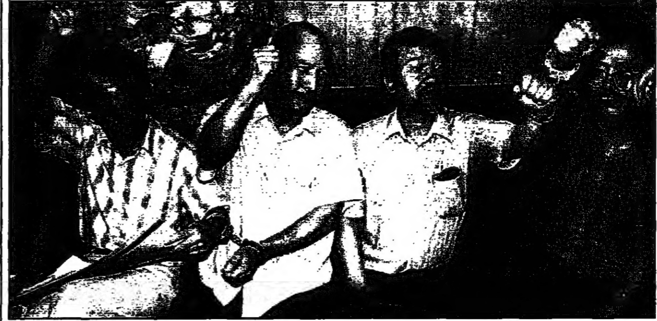
للتهرب اليابانيون بجانسون في قلعة الحكمة امس (روبير)